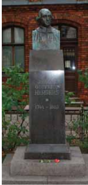
Herderdenkmal in Riga