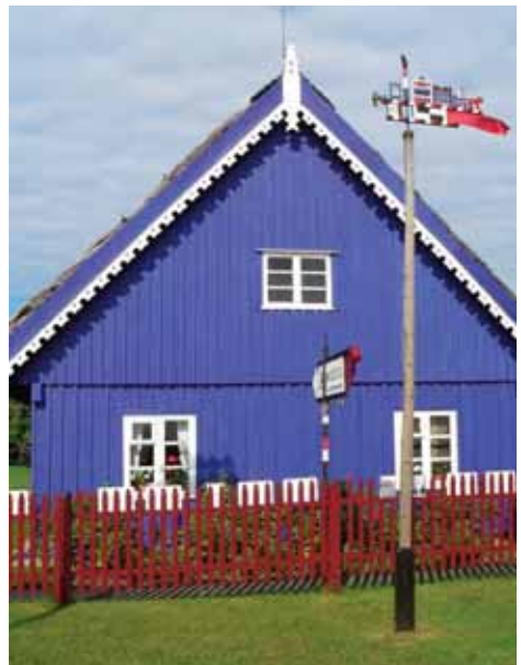
Haus auf der kurischen Nehrung

Als nach gut einer dreiviertel Stunde der Bräutigam an der Spitze eines Umzugs