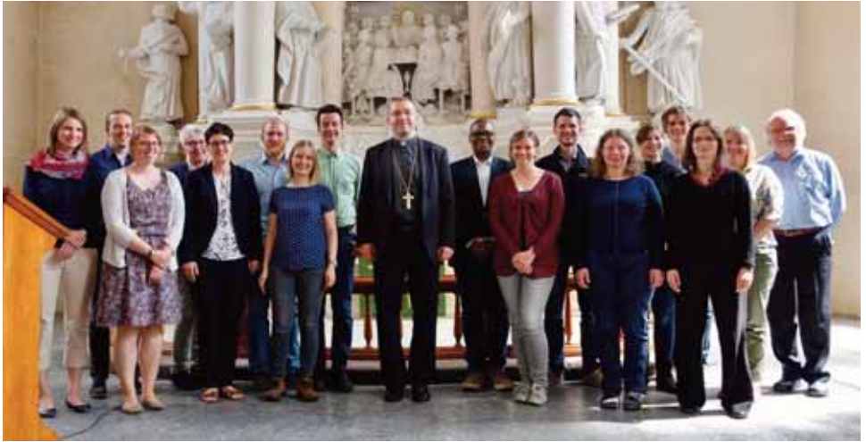
Vikariatskurs 5 mit Bischof Mindaugas Sabutis von der Evangelisch-lutherischen Kirche in Litauen.