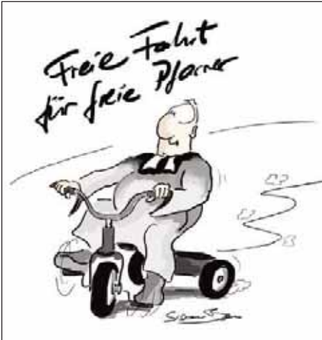
Wenn ein Dienst-PKW schon nicht bei rauspringt. Mehr unter: sisamben.de