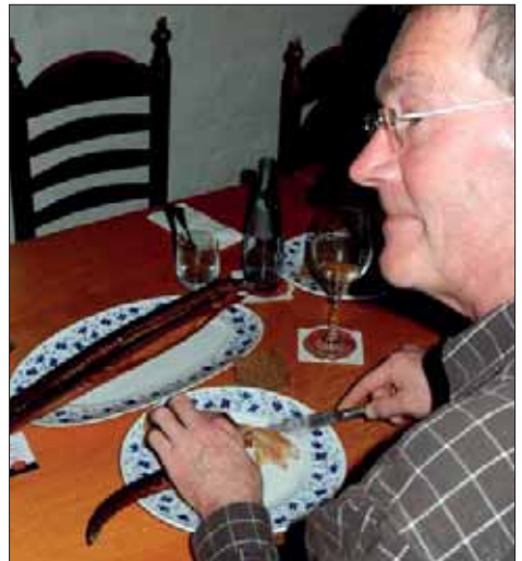
Ein Muss im Oldenburger Land: Aaessen im Spieker in Bad Zwischenahn

Bei Konflikten in den Gemeinden wird kaum in einem geordneten Verfahren entschieden, sondern nach informellen Absprachen. Jahresgespräche gibt es