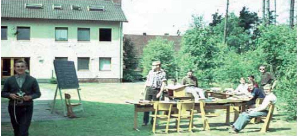
Pfarrvikarsseminar Hermannsburg in den 1960er Jahren