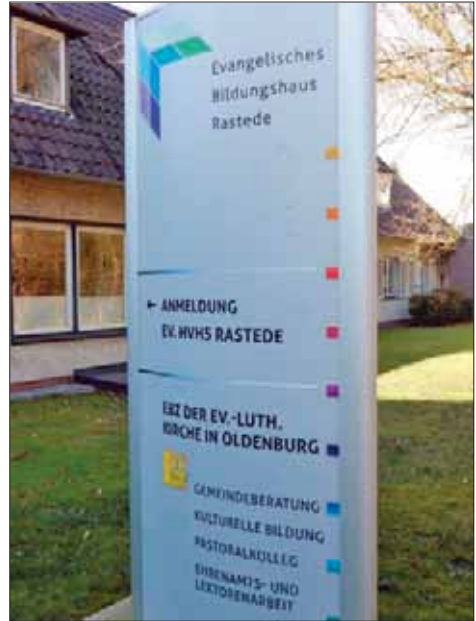
Tagungsstätte in Rastede

Hannover berichtete, dass zurzeit eine neue Verfassung in Vorbereitung ist. In ihr wird die „mittlere Ebene“ weiter gestärkt, bekommt die Kirchenverwaltung erstmals Verfassungsrang, werden die Pfarrkonvente als Gemeinschaft der ordinierten TheologenInnen nicht mehr erwähnt. Immer wieder, so die Erfahrung