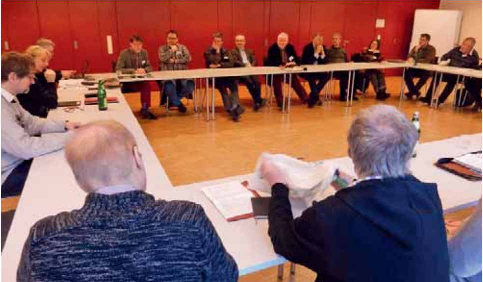
Beratungen im Plenum