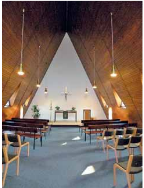
Kapelle der Theologischen Akademie Celle.

Als Ende der 1980er Jahre die sogenannte „Pastorenschwemme“ kam und