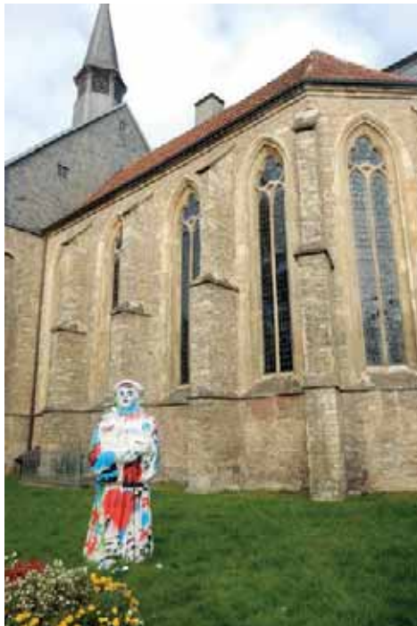
Ein kunterbunter Luther im Jubiläumsjahr.

„Zukunftsfreudig und innovativ“ wäre es, wenn wir die Kirche auch nach 500 Jahren in diesem Sinne wieder reformieren würden. Umfragen haben ergeben, dass Mitglieder der Kirche nur selten austreten, wenn sie vor Ort eine Gemeinde haben.