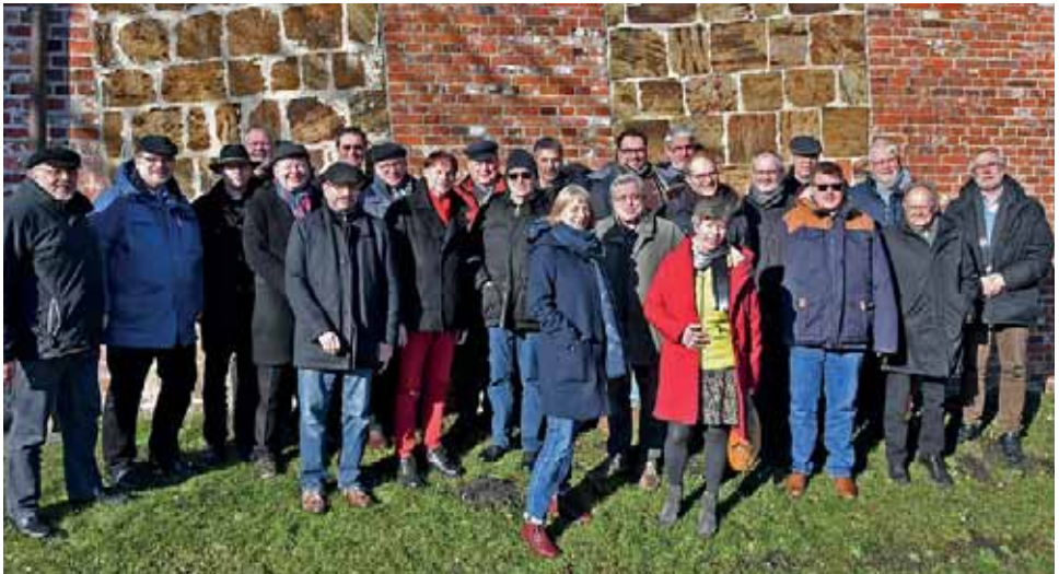
Teilnehmer der Nordschiene

Weit vorn auf dem Weg in die Kirchenkreiskirche sind die beiden großen Kirchen Hannover und Nordkirche. Der von der Beratungsfirma McKinsey angeregte und von der EKD forcierte Weg in eine angeblich besser steuerbare Kirche ist hier schon weit fortgeschritten. Am Beispiel Lübecks berichteten die Nordelbier, wie vor Jahren der Kirchenkreis die Gemeinden mit einer Übernahme der Kasenföhrung („umsonst“) gelockt habe. Viele Gemeinden seien davon angetan gewesen, aus Bequemlichkeit auch Pa-