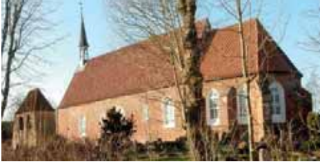
Exkursion zu den Kirchen in Golzwarden und Rodenkirchen in der Wesermarsch