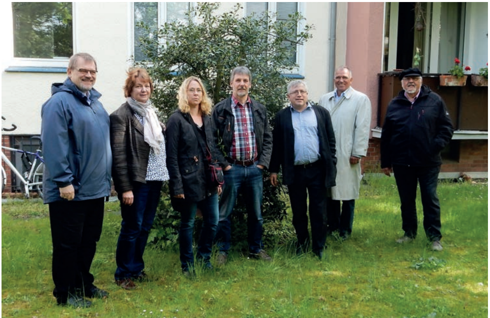
HPV Vorstand vor dem Haus in Hannover - hier ist der Ausbau einer weiteren Wohnung geplant.

Auch wenn derzeit alle Wohnungen vermietet sind, gilt doch: Es wird immer mal wieder eine Wohnung frei. Deshalb sollten sich Interessierte rechtzeitig mit der Geschäftsstelle in Landesbergen (05025 943 698) in Verbindung setzen. Hier erfahren Sie auch weitere Details über die Wohnungen sowie den Ablauf der Vermittlung.