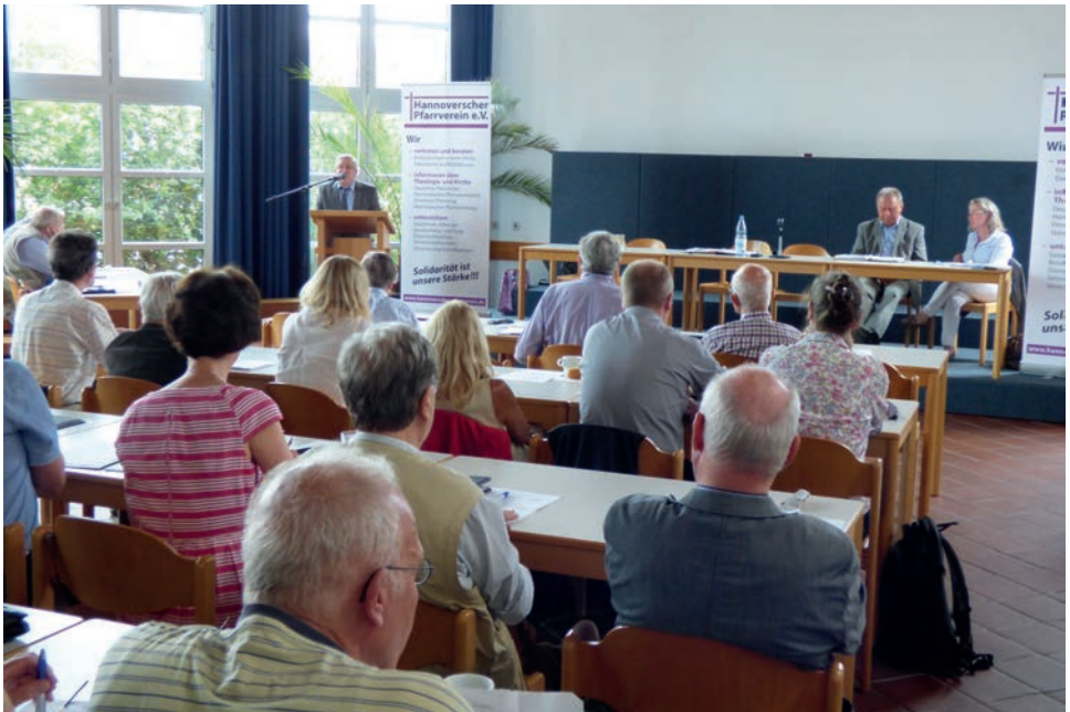
Plenum der Sprecher- und Mitgliederversammlung.

Übrigen auch bekenntniswidrig! Die zentrale Frage im Innovationsprozess, denn um den geht es, wird somit sein, wie die beiden Ziele der