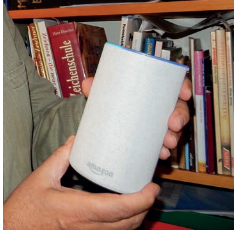
Amazon Alexa - Spion auf dem Schreibtisch?

Nun könnte man sagen: Wer das in seinen eigenen vier Wänden tut, muss