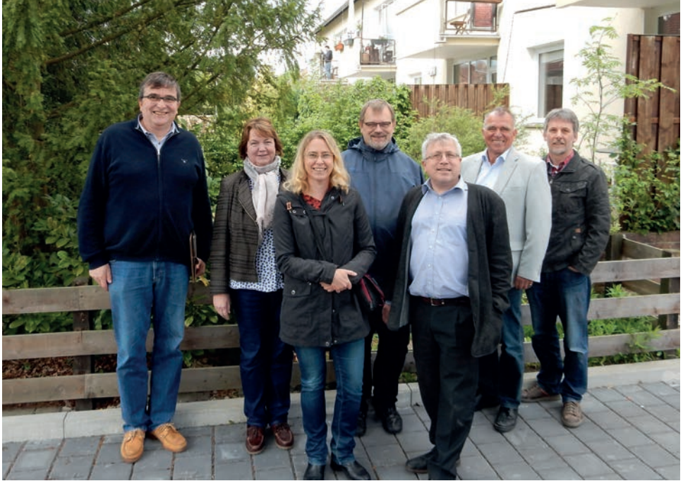
Haus Celle in TOP-Zustand.