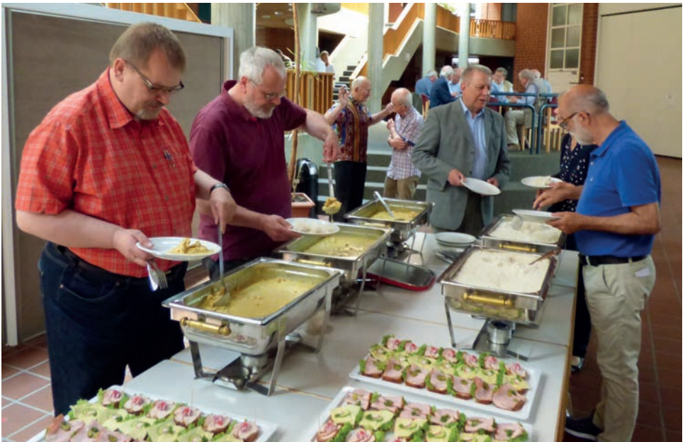
Nach dem Vormittagsprogramm lud der Pfarrverein zum Mittagessen ein.

„Die Probleme werden nach unten durchgereicht“ so ein weiterer Diskussionsbeitrag, der sich vor allem auf die kaum noch durchschaubaren Veränderungen im Urheberrecht, Datenschutz und Steuerrecht bezog. Auch der geistliche Vizepräsident des LKA, OLKR Arend de Vries, sprach die Fülle der von Außen an die Kirche herangetragenen Veränderungen an. Man überlege ständig, was davon nicht von den Pastoren*innen vor Ort erledigt werden müsse und wo und wie man Hilfestellung geben könne.