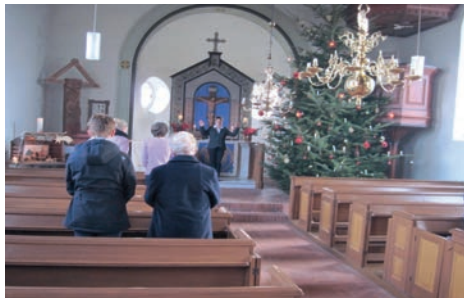
Soll man sich schlecht besuchten Gottesdienst sparen?