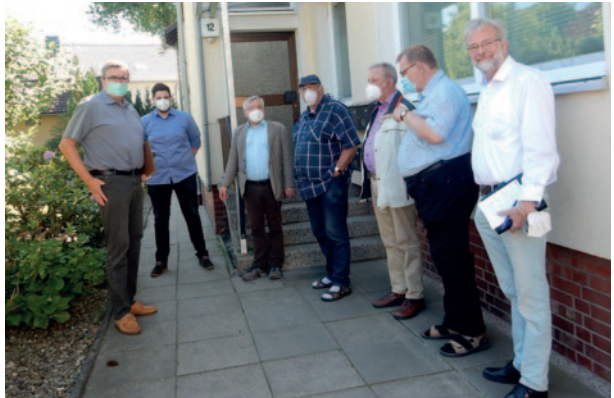
Der Vorstand besichtigt das Haus in Celle.

Dazu besitzt der Verein noch zwei 100 qm große Mitwohnungen in Esens. Auch wenn derzeit alle Wohnungen vermietet sind, lohnt es sich immer mal wieder in der Geschäftsstelle nachzufragen. Dienstags ist Frau Wutkewicz in der Zeit von 9.00 bis 16.00 Uhr für Sie erreichbar.