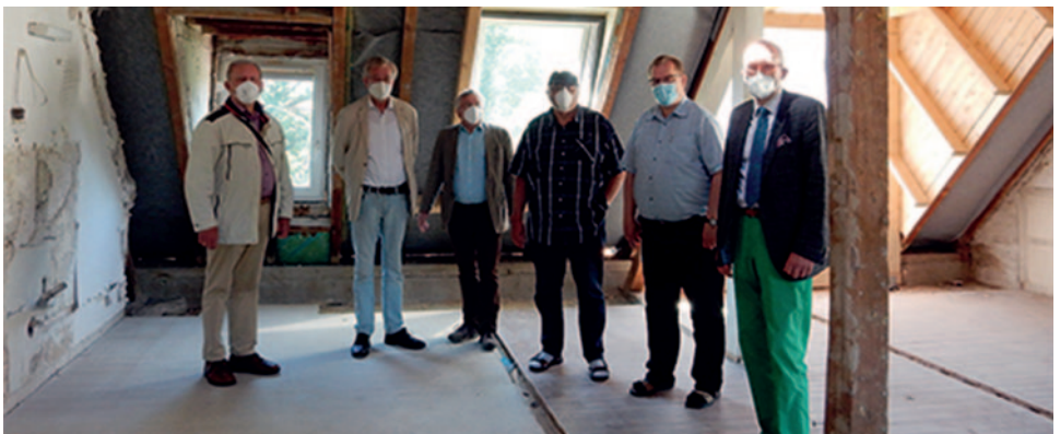
Der Vorstand begutachtet den Fortschritt beim Ausbau des Hauses in Hannover.