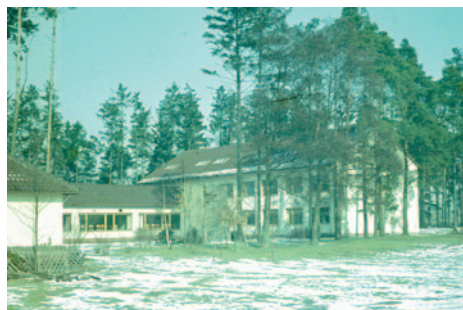
Das „Pfarrvikarseminar“ in Hermannsburg

In Hermannsburg sollten die ersten zwei Jahre der Ausbildung zum „Pfarrvikar“ erfolgen. In den Fächern Bibelkunde,