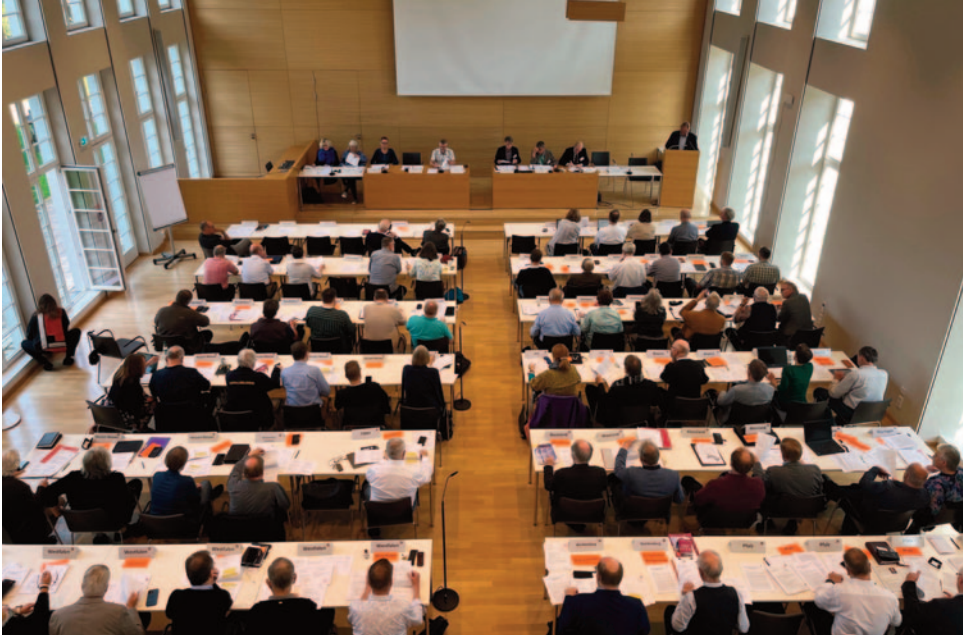
Mitgliederversammlung in Hofgeismar