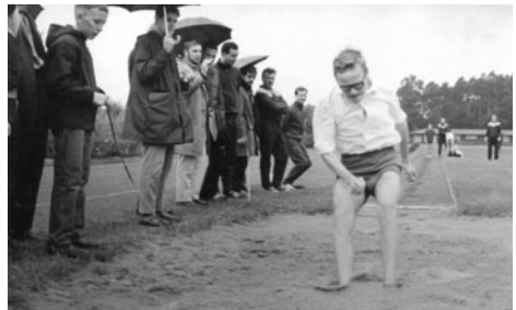
Auch im Sport sollten wir ertüchtigt werden

des Klöppels bis zu Streichen an den Dozenten. Einer hatte Mitleid mit uns: „meine Herren, ich sehe ihre Lampen bis in die Nacht brennen, übertreiben sie es mit dem Arbeiten nur nicht“. Auf die Idee, dass eine Lampe als - wie wir es nannten - „Arbeitsmaschine“ auch für sich selbst leuchten kann, wir hingegen längst bei Pomp in der „Örtzebrücke“ oder in Schip-schacks Kneipe bei Currywurst oder Solei und Bier saßen und Udo Jürgens „17 Jahr blondes Haar“ Mädchen nachträumten, kam er - zum Glück - nicht. Eine alte Erfahrung wurde Realität: je größer der Druck, umso stärker die Suche nach Ventilen.