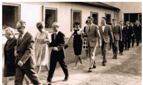
Einübung gesellschaftlicher Anlässe: der Semesterball (die Bowle wurde im Verlauf des Abends durch heimlich hineingekippte Alkoholika immer stärker)

Ebenso herabwürdigend waren die Versuche, uns zu gutem Benehmen zu erziehen. So gab es Unterricht, wie man denn mit Messer und Gabel umgeht und wie man sich bei einer gesellschaftlichen Einladung benimmt. Dazu wurde man dann im kleinen Kreis zu unserem Hermannsburger Leiter und seiner Frau zu einem Abendessen gebeten. Man thematisierte sogar, bei wem man später, wenn man ins Pfarramt kommt, einen Antrittsbesuch machen sollte. Man bedenke: am Beginn einer siebenjährigen Ausbildung! Mich hat das nur wütend gemacht.