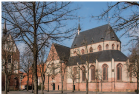
Ludgerikirche Norden

Nachdem ich in Celle die zweite Zwischenprüfung erfolgreich bestanden hatte, ging es nach den Semesterferien 1970 in ein halbjähriges Vikariat in eine Gemeinde. Wir konnten uns unsere Stellen weitgehend selbst aussuchen.