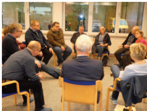
In Kleingruppen wurde das Gespräch mit Bischöfin Fehrs vorbereitet

die "ForuM-Studie" über Missbrauch in der evangelischen Kirche sein würde, hatten sich die Teilnehmer der „Nordschiene“ in Kleingruppen auf dieses Thema vorbereitet.