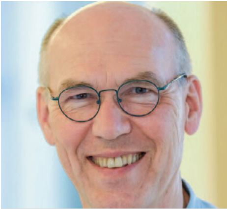
OKR Helmut Aßmann Personalabteilung im Landeskirchenamt