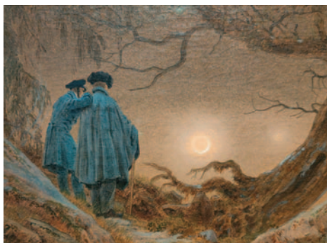
Zur „Erholung" ging es in die Caspar - David - Friedrich Ausstellung in der Kunsthalle