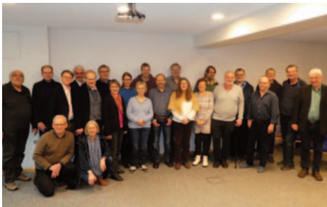
Die Teilnehmer der „Nordschiene“

Die bremische Kirche ist von einer weitgehenden Eigenständigkeit ihrer Gemeinden geprägt. Die versucht die Zentrale abzubauen, ist aber zunächst mit einer entsprechenden Verfassungsänderung in der Synode gescheitert. Der Verein bemüht sich um eine Höchstwochenstundenzahl von 40 (bisher 56!). Gleich der Mitgliederzahl ihrer Kirche verzeichnet auch der Verein einen Mitgliederschwind, hat mit seinen 115 Mitgliedern aber noch eine hohe Quote.