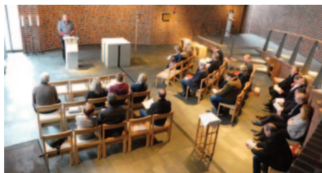
Die Tagung begann mit einer Andacht in der Kapelle des Ansgarhauses

Traditionell treffen sich zwischen Rosenmontag und Aschermittwoch die Vorstände der Norddeutschen Pfarrvereine und Pfarrvertretungen zu einem Erfahrungsaustausch. Ziel ist es, die Entwicklung der Rahmenbedingungen für Pastorinnen und Pastoren in ihren Kirchen nicht auseinanderdriften zu lassen. Ort war diesmal das St. Ansgar-Haus, eine katholische Tagungsstätte in der Nähe des Hamburger Hauptbahnhofs. Eingeladen hatte der Verein der Pastorinnen und Pastoren in Nordelbien.