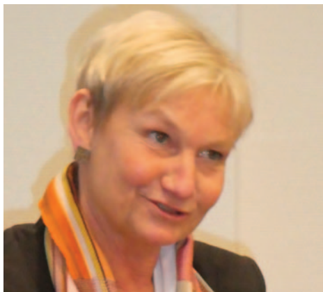
Bischöfin Kirsten Fehrs