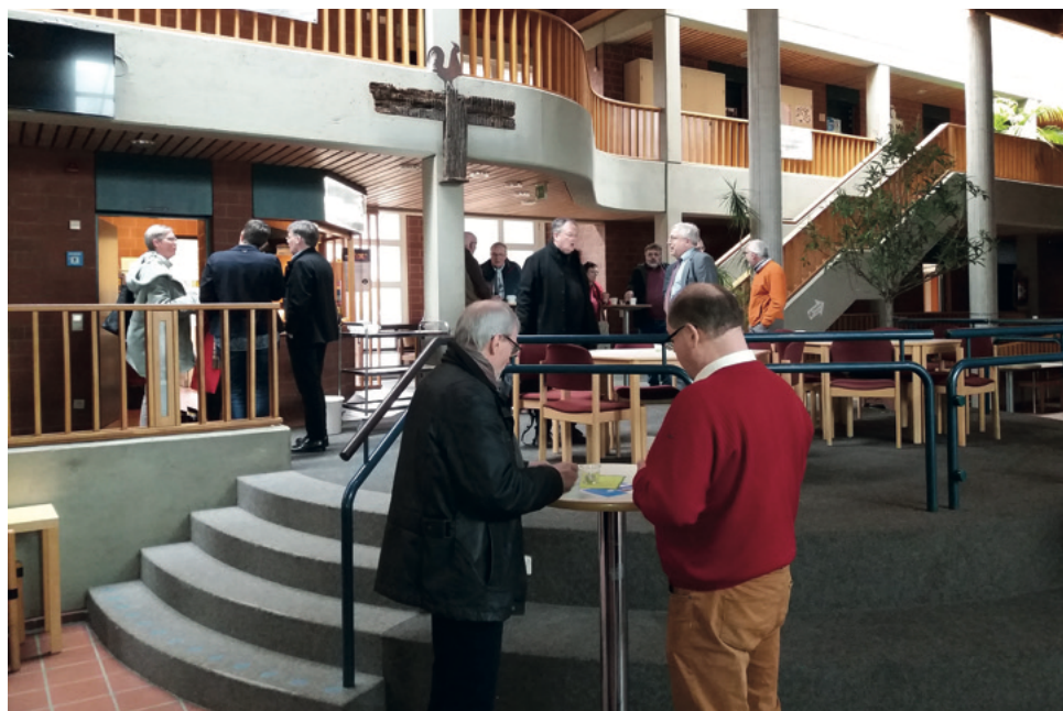
Pfarrvereinstag im Mühlbergzentrum Hannover.

Das Thema sexualisierte Gewalt/Missbrauch in der Ev. Kirche beschäftigt uns natürlich auch alle in hohem Maße. Die medialen Wellen schlugen, wie zu erwarten, nach dem 25. Januar, als die Studie veröffentlicht wurde, hoch und das Thema ist und bleibt im Hintergrund natürlich bei vielen virulent. Nachdem ich es unlängst in meiner ‚Gemeinde im Gottesdienst thematisiert hatte, sprachen mich viele sehr Gottesdienstbesucher darauf an. Das zeigt, wie sehr dieses Thema die Menschen beschäftigt. Es ist teilweise unfassbar und beschämend, was da in der Vergangenheit geschehen ist – und auch, wie damit umgegangen wurde, Stichwort Oesede-Bericht. Der Missbrauch von Kindern und Jugendlichen ist schockierend,