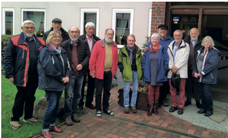
Jahrgang K mit Ehefrauen beim Jahrgangstreffen zum 50. Ordinationsjubiläum

Ab 1.1.1967 führten die hier Ausgebildeten den Titel Pastor. Als Begründung sagte Landesbischof D. Hanns Lilje vor der Synode: „Hier ist ein anderer Weg beschritten, aber – wir sind überzeugt – ganz gewiß kein schlechter Weg. Das Resultat ist entscheidend. Die Sorgfalt des Ausbildungsganges ist beachtlich. Ich glaube, dass eine Landeskirche mit einem solchen Plan in der Tat einen guten Beitrag zur Gewinnung ausreichender geistlicher Kräfte für die Versorgung der Gemeinden leisten kann.“