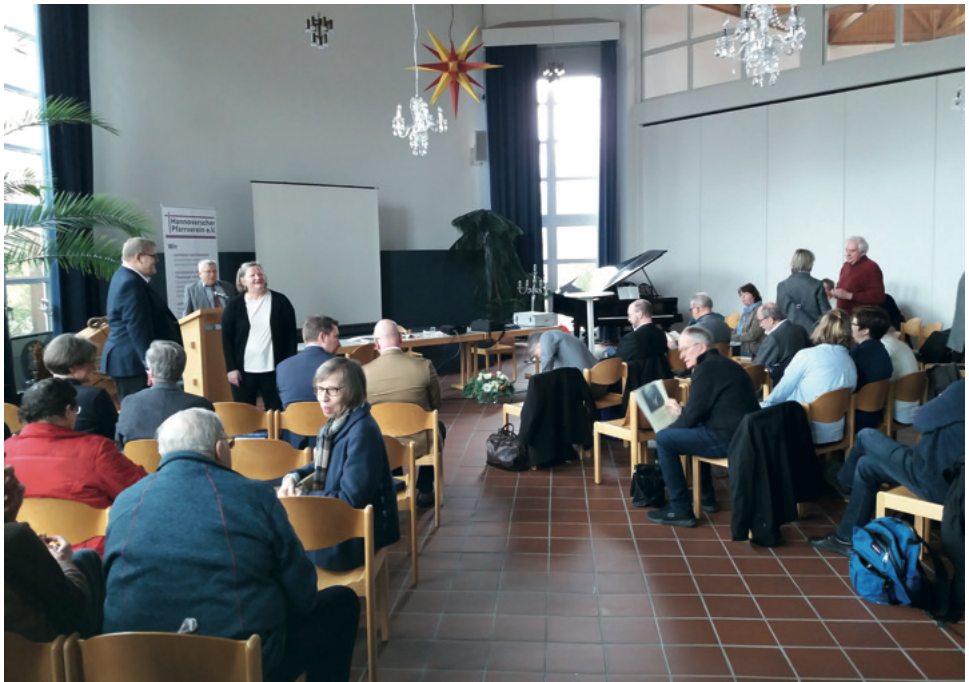
Der Pfarrertag in der Bonhoeffer-Kirchengemeinde auf dem Mühlberg

Viele dieser freien Stellen, gerade die in den zahlreichen strukturschwachen Regionen, liegen schon jetzt lange brach, was für hohe Belastungen bei den VakanzvertreterInnen sorgt. Hier muss dringend Abhilfe geschehen, hier müssen si-