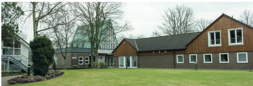
Theologische Akademie Celle, Berlinstraße. Rechts der Block D zur Vorbereitung auf die Abschlussprüfung

Wenn man meine Zensuren an den beiden Tagen der Schlussprüfung ansieht, dann merkt man, dass sie schleichend immer etwas schlechter wurden. War man am Beginn auf der Höhe, so schlaffte die Aufmerksamkeit Stück um Stück ab.