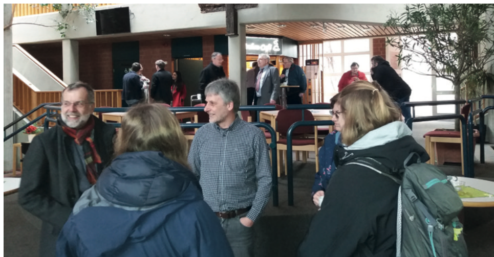
Pause zum Klönen