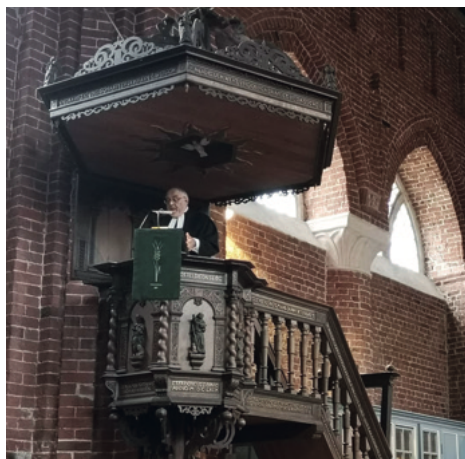
Zum Ordinationsjubiläum am 6.11.2022 noch einmal auf der Kanzel der Marienkirche Marienhafe

Am 5. Oktober 2022, 50 Jahre und einen Tag nach meiner Ordination, durfte ich