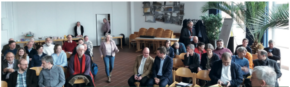
Pfarrertag in Hannover