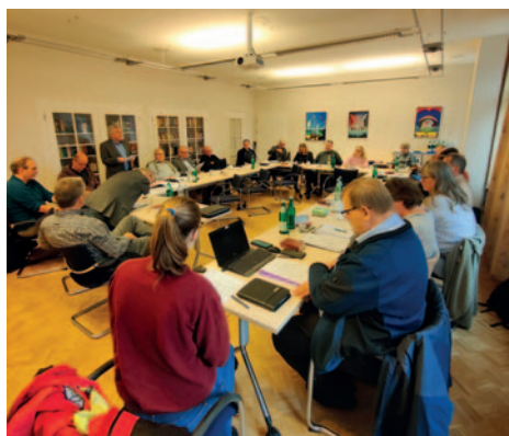
Sprecherinnen- und Sprecherversammlung

Die Beschlussfähigkeit wird festgestellt. Die Tagesordnung wird wie folgt geän-