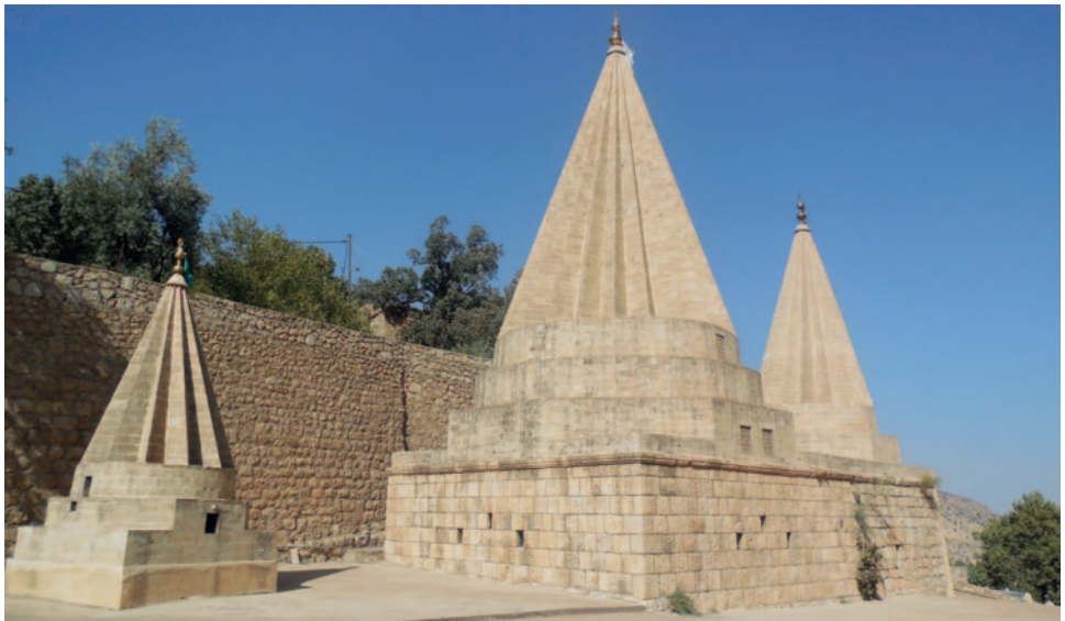
Tempel in Lalish

einen Gott und seinen Erzengel Tawisî Melek (Engelpfau). Es gibt keinen Widersacher Gottes. Eziden verstehen sich als