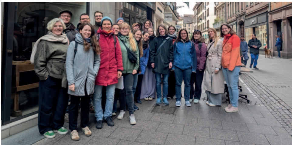
Der Kurs unterwegs in Straßburg