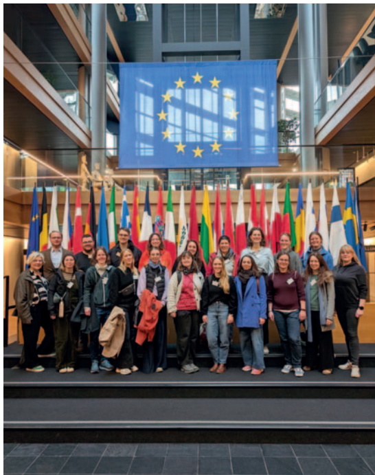
Vikarskurs im Europäischen Parlament